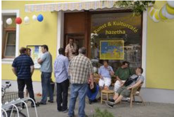
Café hazetha öffnet seine Pforten

Am Mittwoch, dem 7. August 2013 eröffnete um 15:00 Uhr das Cafe Hazetha nach mehreren Monaten der Komplettsanierung seine Pforten für einen fulminanten Neustart. Mitarbeiter und Bewohner des Hauses begrüßten die Gäste gewohnt warm und herzlich.